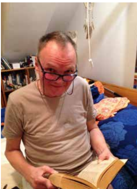
Heute im Rollstuhl, aber noch immer am Puls der Zeit und wacher Zeitgenosse.

„Ich weiß bis heute nicht einmal, ob ich ein primäres oder sekundäres Lymphödem habe“, sagt der nach wie vor jugendlich