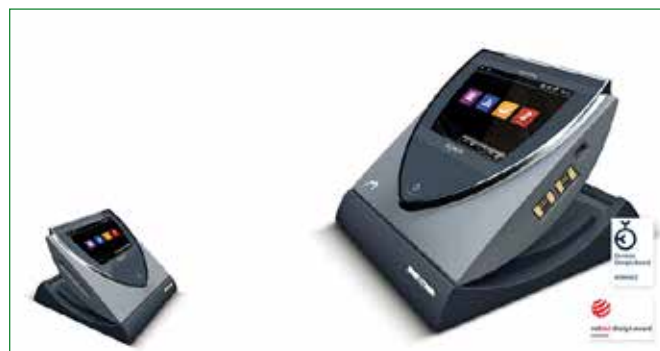
Steuergerät von Bemer.