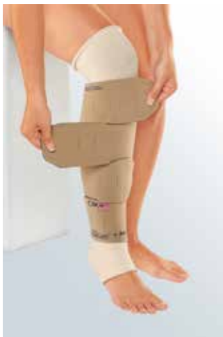
Circaid: positive Ergebnisse, Erleichterung für Patienten.

Je nach der Dehnbarkeit des Kompressionsmaterials werden nachgiebige, „gummielastische“ Textilien (Langzugbinden, Kompressionsstrümpfe) von mehr starren, unnachgiebigen Materialien (Zinkleimbinden, Kurzzugbinden) unterschieden.