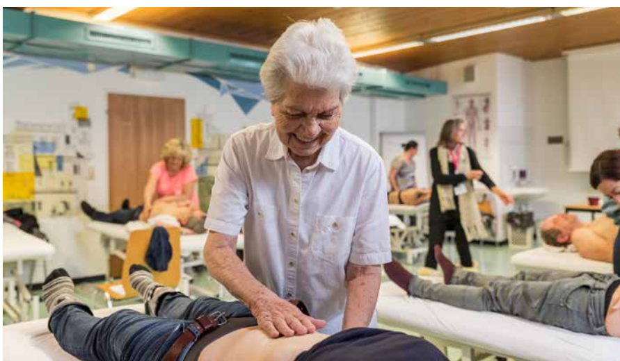
Bis heute mit Begeisterung bei der manuellen Lymphdrainage.