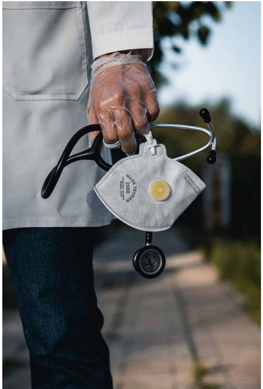
Melanie Wohlgenannt: Ausreichend Schutzkleidung für das medizinische Personal zu besorgen kostete viel Zeit und Energie.

Die Zeit zwischen dem 14.3.2020 und dem 14.04.2020 war für uns in Tirol lebende Menschen die Zeit der strikten Ausgangssperre. Ganz Tirol war unter