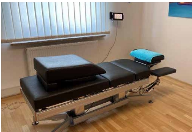
Seit 2018 wird der Schwingtisch an der MedUni Wien, in der betrieblichen Gesundheitsvorsorge eingesetzt.

Die Undopathie ist ein Befundungs- und Behandlungskonzept, das auf Schwingungs- und Vibrationstechnik beruht. Durch Vibrationen und Wellenbewegungen werden Störungen und Bewegungseinschränkungen von Faszien, Muskeln, Wirbeln, Gelenken und verschiedener Gewebsarten erspürt und behandelt.