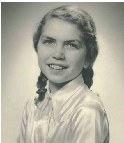
Als junges Mädchen galt die Leidenschaft der gebürtigen Stuttgarterin den Sprachen. Sie studierte Englisch und Spanisch.