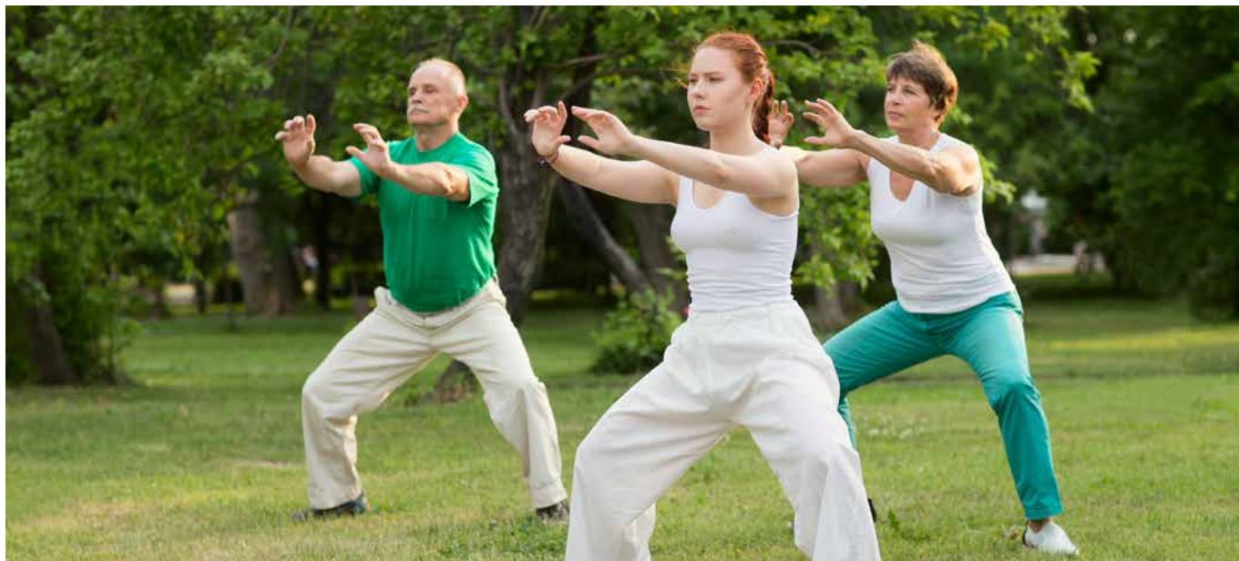
Qigong kann eine Verbesserung des Lymphrückflusses bewirken.