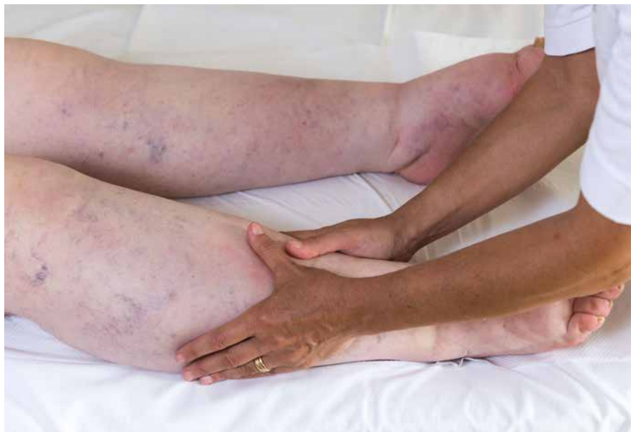
Genauso wichtig wie eine regelmäßige Lymphdrainage ist im Rahmen der KPE eine tägliche Hautpflege.

Bei lange bestehenden Ödemen kommt es auch zu Veränderungen in der Lederhaut (Dermis) die zunehmend fibrosiert (vernarbt) und der Subcutis (Fettschicht) in Form von Liposklerose (verhärtet). Schließlich fühlt sich die betroffene Extremität wie „zementiert“ an. In diesem Stadium lassen sich die Ödeme selbst durch die beste