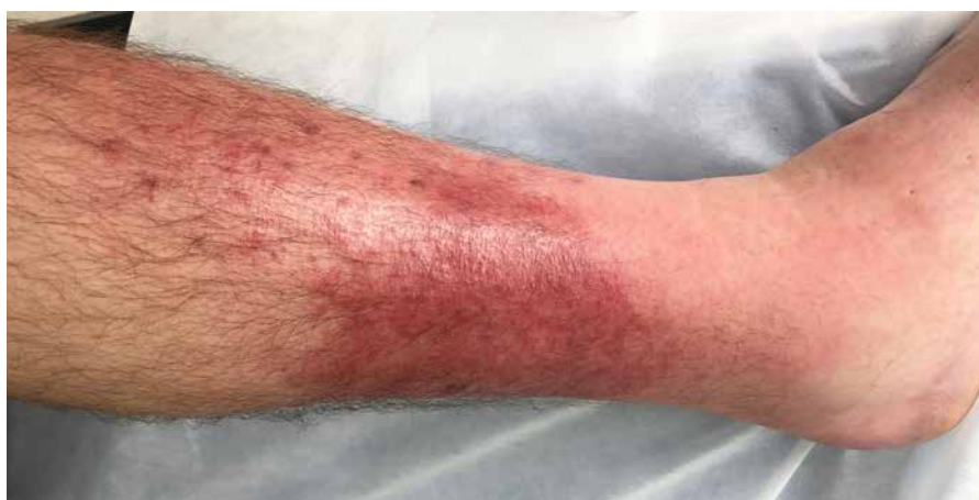
Die häufigste bakterielle Infektion ist das Erysipel.

Falls Sie nach Rücksprache eigene Pflegeprodukte verwenden wollen, achten Sie auf folgende Inhaltsstoffe. Duftstoffe, ätherische Öle; Pflanzenextrakte („Ringelblume“); Wollwachs (Lanolin) und Propolis sind heute die häufigsten Auslöser von Allergien und sollten bei Lymphödem gemieden werden.