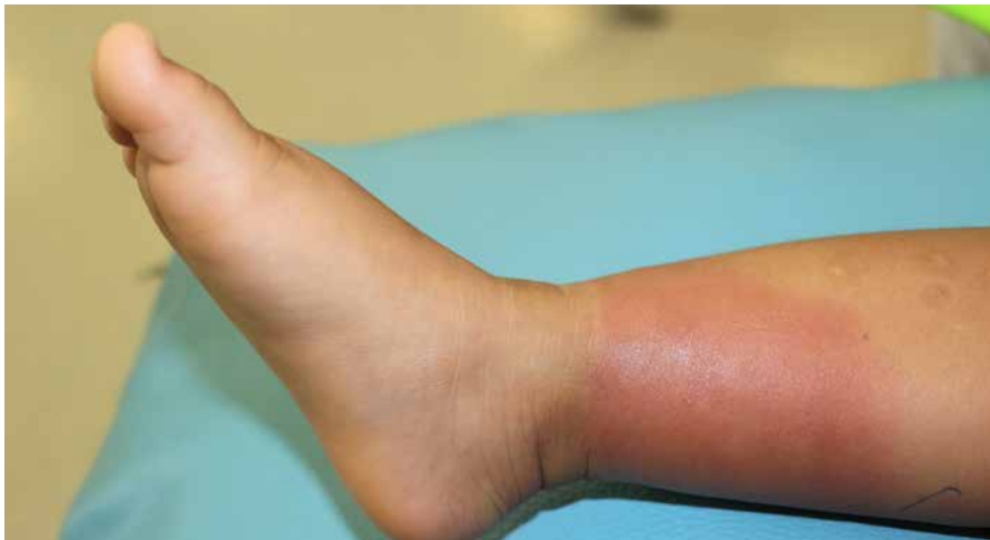
Kleine Verletzungen können zu einem Erysipel führen.