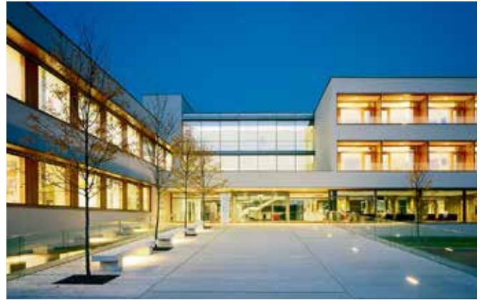
Lymphklinik Wolfsberg

Die Veranstaltung begann mit Vorträgen zur Patientenauswahl bei der Lymphchirurgie, zu supermikrochirurgischen Verfahren sowie der heilenden Rolle der rationalen lymphatischen Mikrochirurgie. Diskutiert wurden intraoperative Fluoreszenzangio-