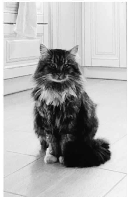
Bei einer Fußbodenheizung sollte man nicht zulange auf der selben Stelle verharren