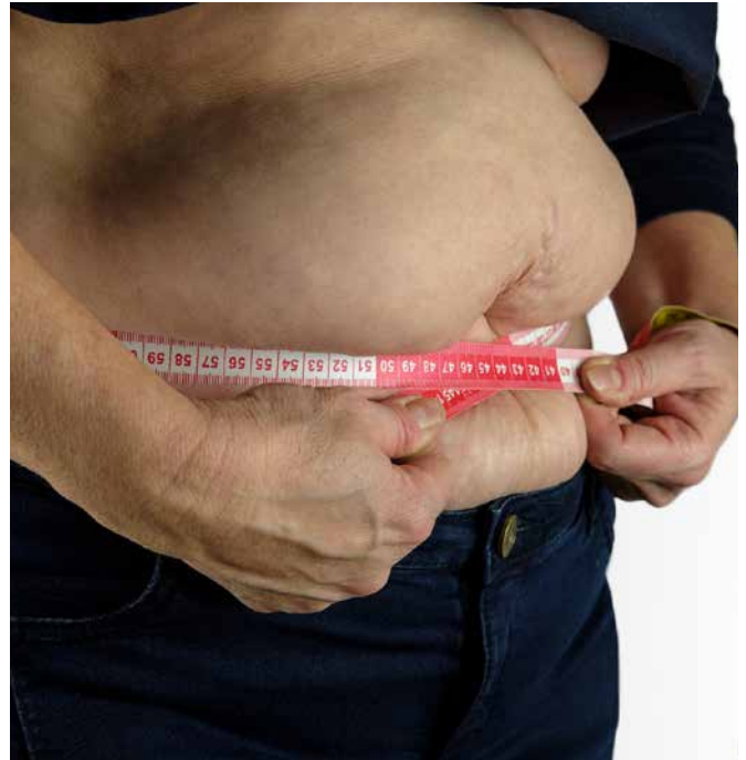
Adipositas kann nicht nur bestehende Lymphödeme verschlechtern, sondern auch Lymphödeme verursachen.

Die österreichische Adipositas Allianz (ÖAA) fordert seit Jahren, dass Adipositas als eigenständige Erkrankung anerkannt wird, um die öffentliche Wahrnehmung zu schärfen und die Stigmatisierung von Betroffenen zu verringern. „Adipositas muss endlich als ernsthafte Erkrankung anerkannt werden“, betont