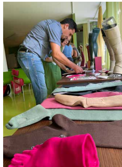
Die Firma Medi unterstützte den Lymphinfotag.

zum Erfolg bei der Therapie von Lymphödemem.