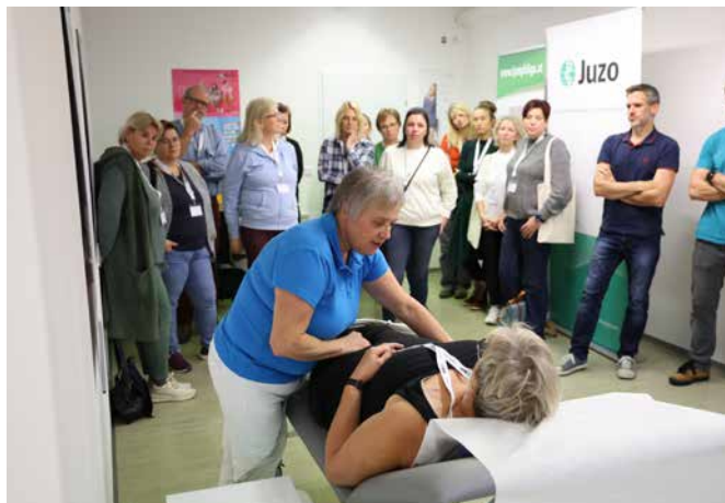
Beim ersten Innviertler Lymphntag wurde ordentlich Hand angelegt