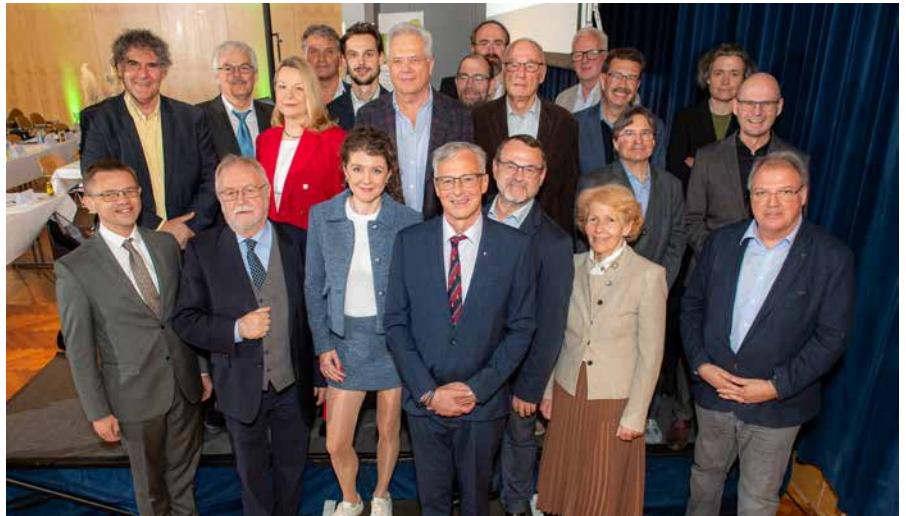
Hochkarätige Expert:innen sorgten auch heuer für spannende Einblicke beim Lymphkliniktag.