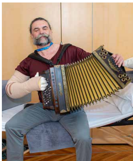
Mit Bandage und Taktgefühl: Auch mit Kompression lässt sich für Stimmung sorgen!